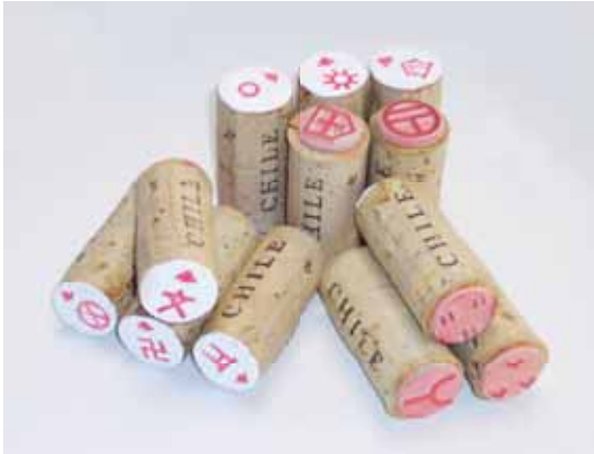
『地図記号スタンプ』(12種セット)

ワインのコルク栓が地図記号スタンプに 卓球のラケットになれなかった木曾ヒノキが地図パズルに